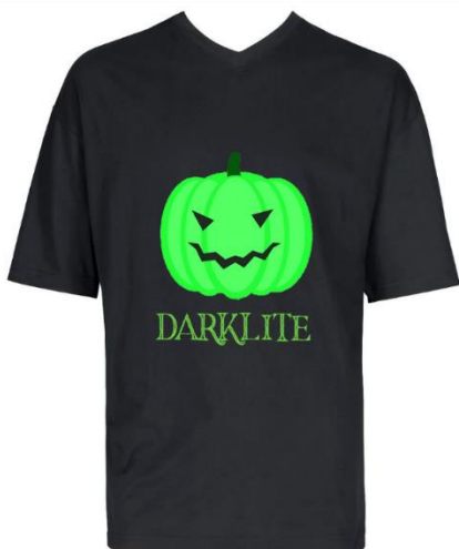
In dunkler Umgebung