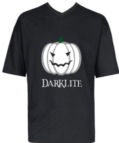
In normaler Umgebung